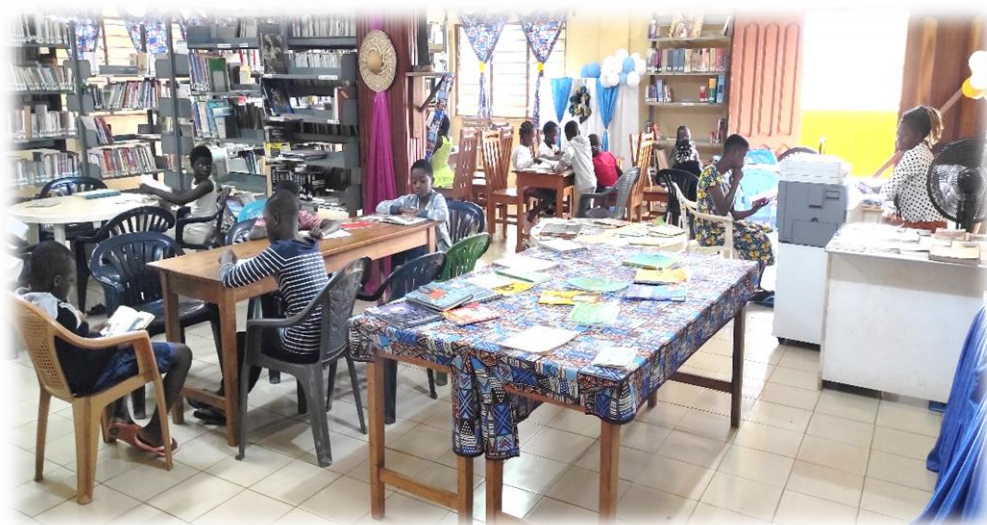
Figure 3 : une séance de lecture dirigée avec les enfants

La bibliothèque des CSL a une mission d'accompagnement et de soutien à l'étude et à la recherche. Elle identifie, acquiert et rend accessibles les ressources, pour les élèves, les étudiants et les chercheurs. Elle propose et offre à toute personne qui le désire ses services de consultations sur place et de prêt à domicile d'ouvrages.