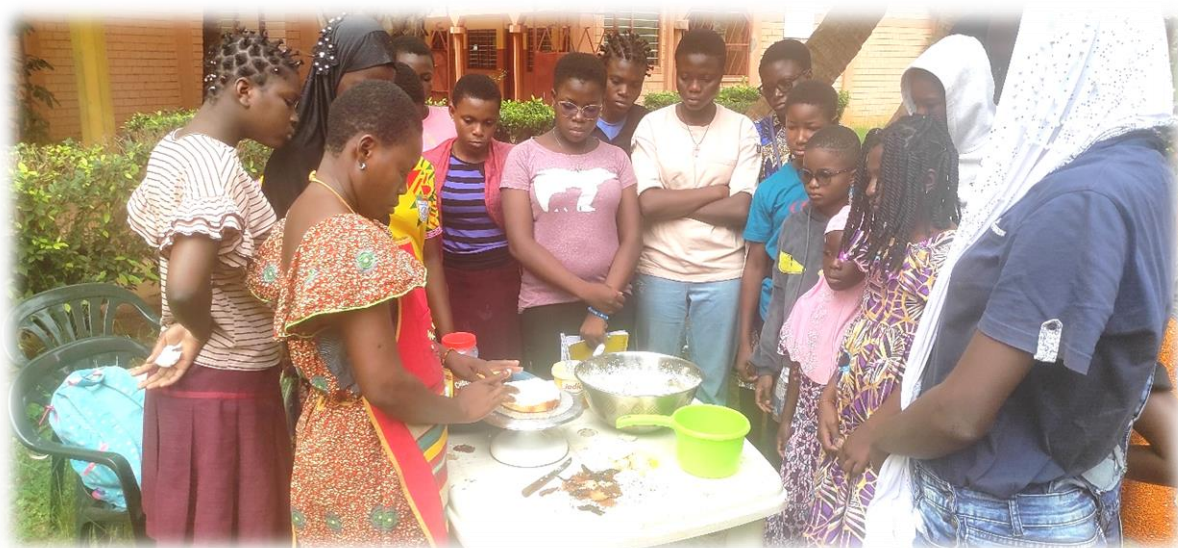
Figure 16 : ornement du gâteau d'anniversaire

Ce programme est réalisé chaque année aux CSL et a pour but de rendre utiles les vacances aux participants, en les aidant à découvrir et à développer leur intelligence pratique et à acquérir des compétences manuelles utiles à leur vie quotidienne. L'édition 2024 a eu lieu de juillet à août et a regroupé deux-cent quarante-neuf (249) jeunes, répartis en différents ateliers dont la décoration-emballage, la fabrication du gâteau d'anniversaire et du yaourt grotto au chocolat, la fabrication des éventails en pagne, du détergent et du déodorant de ménage.