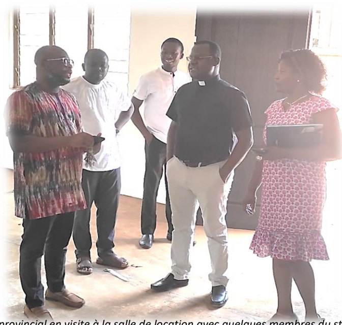
Figure 20 : le provincial en visite à la salle de location avec quelques membres du staff CSL

Le P. Mathieu NDOMBA, SJ, provincial de la province jésuite de l'Afrique de l'ouest a effectué sa visite annuelle à la communauté et aux œuvres jésuites de Lomé en octobre 2024. Au cours de cette visite, le Père Provincial a rencontré le staff des Centres Sociaux Loyola. L'objectif de cette rencontre est de se familiariser davantage avec les collaborateurs, de faire le point sur les avancées depuis la dernière rencontre, d'explorer les difficultés rencontrées et de recueillir des propositions nécessaires à l'évolution des centres. Le staff a présenté les projets en vue au provincial. La question de l'autonomisation financière des centres a été largement au cœur des discussions. Le Père Provincial a attiré l'attention du staff sur la gestion optimale des infrastructures existantes qui devraient constituer un véritable atout pour les centres. Il l'a invité à repartir sur de bonnes bases, en exploitant ces opportunités existantes en vue du rayonnement et de l'autonomisation financière des centres. La mise à jour de notre agenda de partenaires techniques et financiers est également très importante. Le provincial a eu l'occasion de visiter quelques espaces des centres avant de se retirer.