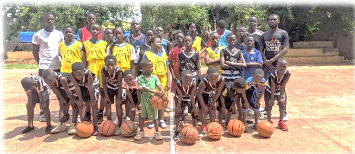
Figure 6 : photo de groupe des joueurs avant le tournois

De même, un tournoi de basket a réuni les jeunes adolescents de 4 à 17 ans,