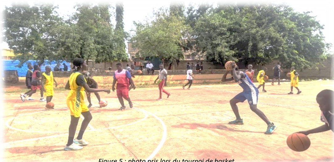
Figure 5 : photo pris lors du tournoi de basket

Grâce aux terrains de football, de basket et de volley des CSL, plusieurs jeunes et adultes ont pu entretenir leur santé physique et mentale à travers une variété d'activités dont la zumba, le footing, le basket, le taekwondo et le volley ball.