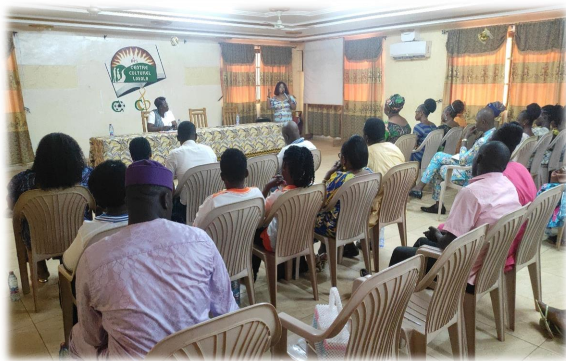
Figure 18 : causerie débat avec les participants

Cette journée a pour objectif de mettre en avant la lutte pour les droits des femmes et demeure un rendez-vous important pour établir le bilan non seulement des avancées mais aussi des progrès restant à accomplir pour parvenir à l'égalité hommes et femmes. L'édition 2024 avait pour thème : Investir en faveur des femmes : accélérer le rythme.