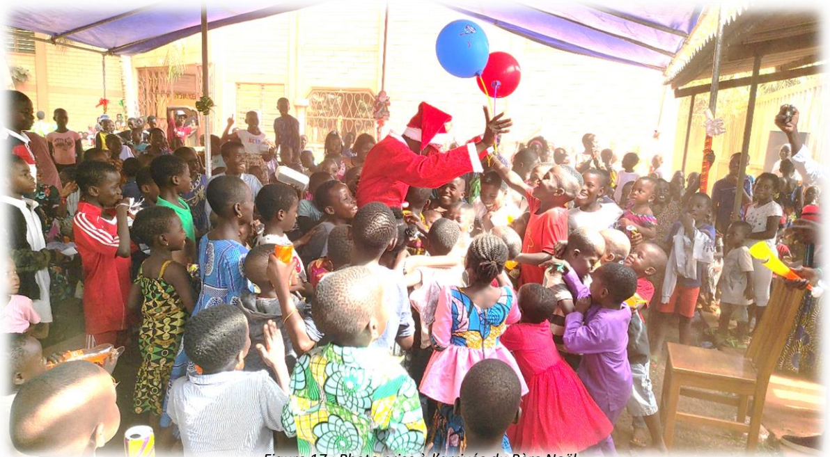
Figure 17 : Photo prise à l'arrivée du Père Noël

L'édition 2024 de "Noël des Orphelins et Enfants Vulnérables " a eu lieu le 23 décembre 2024 dans les locaux des Centres Sociaux Loyola. Cinq cent quarante-quatre (544) enfants composés des Orphelins de père et/ou de mère, des enfants en situation de handicap, des enfants issus des familles défavorisées ont pris part à cette festivité. Etaient également présents quelques parents et tuteurs, de même que le personnel d'encadrement.