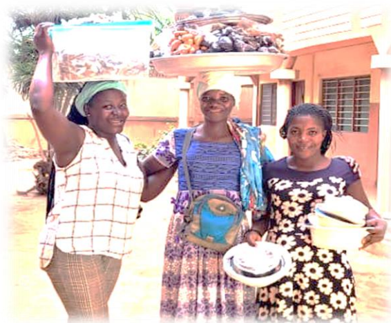
Figure 10 : femmes ayant bénéficié d'un soutien économique tenant une échantillon de leur marchandise