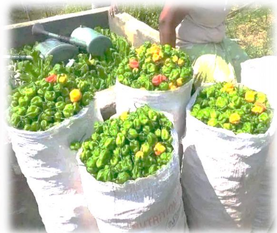
Figure 11 : Exemple d'un projet d'AGR soutenu par les CSL