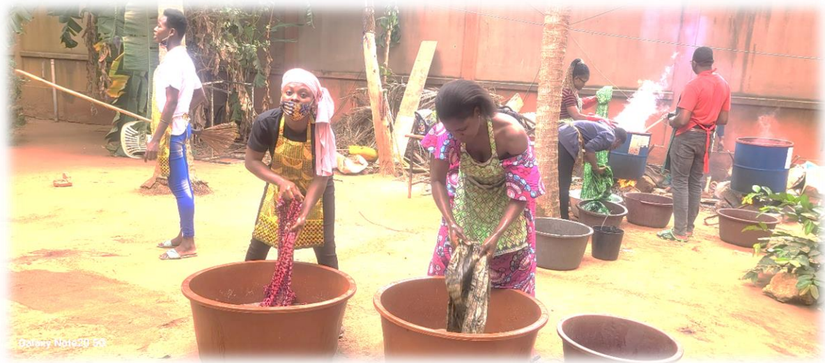
Figure 12 : femmes de la coopérative de BATIK en séance de fabrication

Ce sont des formations pratiques et des recyclages en fabrication de savon, des séances de tampon batik ou de fabrication des amuses gueules. Un nouveau groupe uniquement pour coopérative Batik a été créé. Vingt-quatre (24) rencontres ont eu lieu avec au moins 20 femmes bénéficiaires.