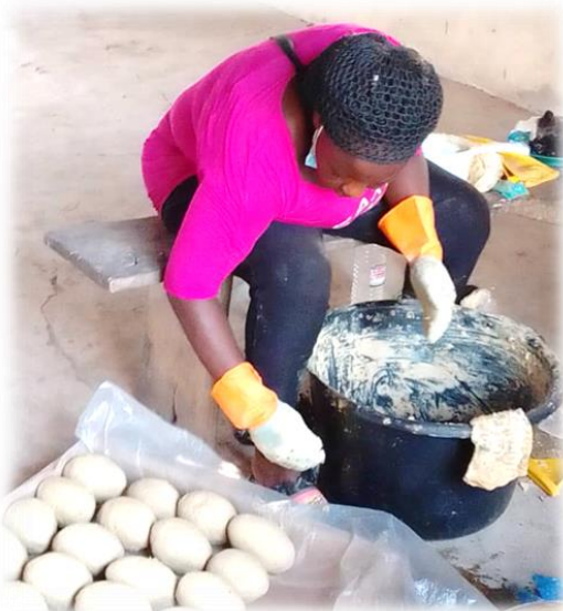
Figure 13 : femmes en train de donner une forme au savon après fabrication