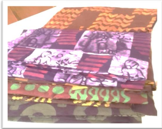
Pagnes BATIK en plusieurs motifs