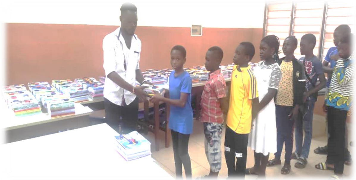
Figure 8 : photo de remise des fournitures aux enfants

Depuis leur création, les Centres Sociaux Loyola se sont engagés au côté des bénéficiaires en situation de vulnérabilité extrême en appuyant la