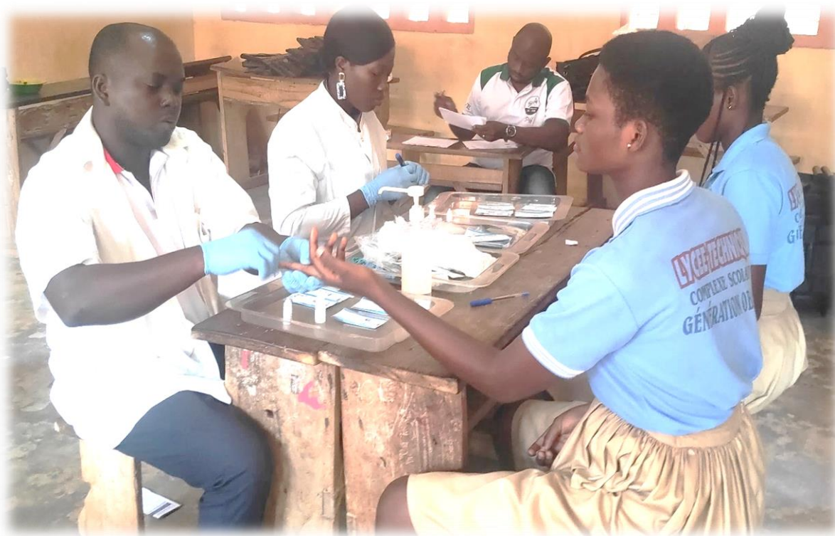
Figure 19 : séance de prélèvement au cours d'une opération de dépistage

Le laboratoire du CEL réalise le test VIH, la recherche de l'antigène Hbs, et le comptage des lymphocytes TCD4 dans le but de contribuer au diagnostic et au suivi des patients déclarées sujets Séropositifs. Au total, Mille-cent-quatre-vingt-dix-huit (1198) tests VIH ont été réalisés avec six (06) cas positifs ; Cinq-cent-cinquante-neuf (559) tests d'hépatite B réalisés avec quinze (15) cas positifs ; cinq (05) cas de Co infection au VIH et à l'hépatite B et deux cent deux (202) comptages des lymphocytes TCD4 ont été réalisés.