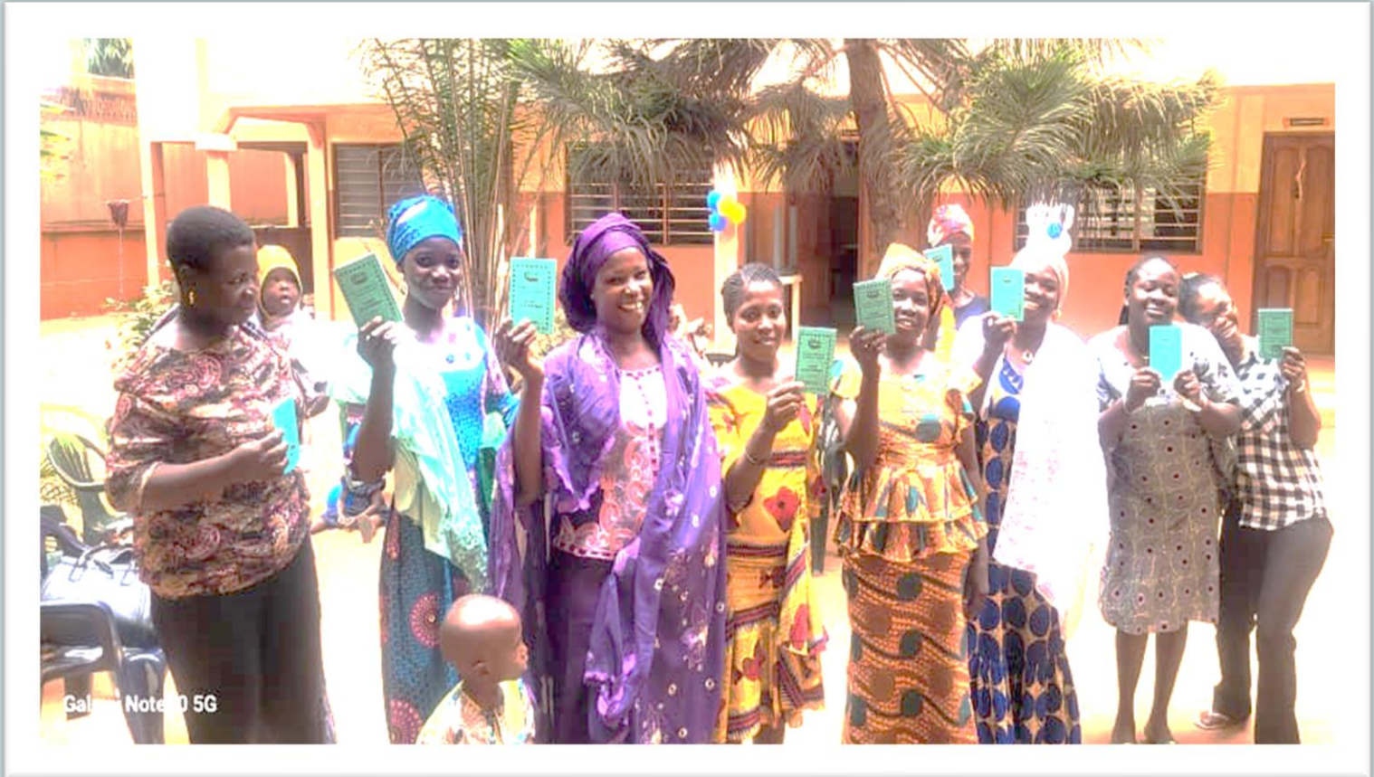
Gal... Note 0 5G