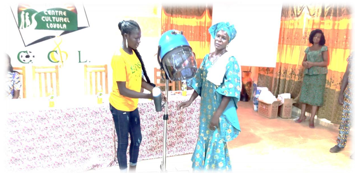
Figure 15 : Remise de matériel de travail à une jeune fille en formation de coiffure

Trente-deux (32) jeunes ont été accompagnés en entrepreneuriat durant toute l'année dans le développement d'idées d'entrepreneuriat.