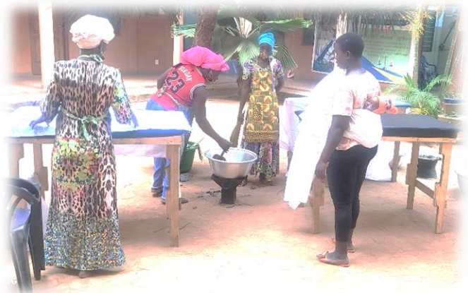
Figure 14 : femmes de la coopérative faisant des amuses-gueules