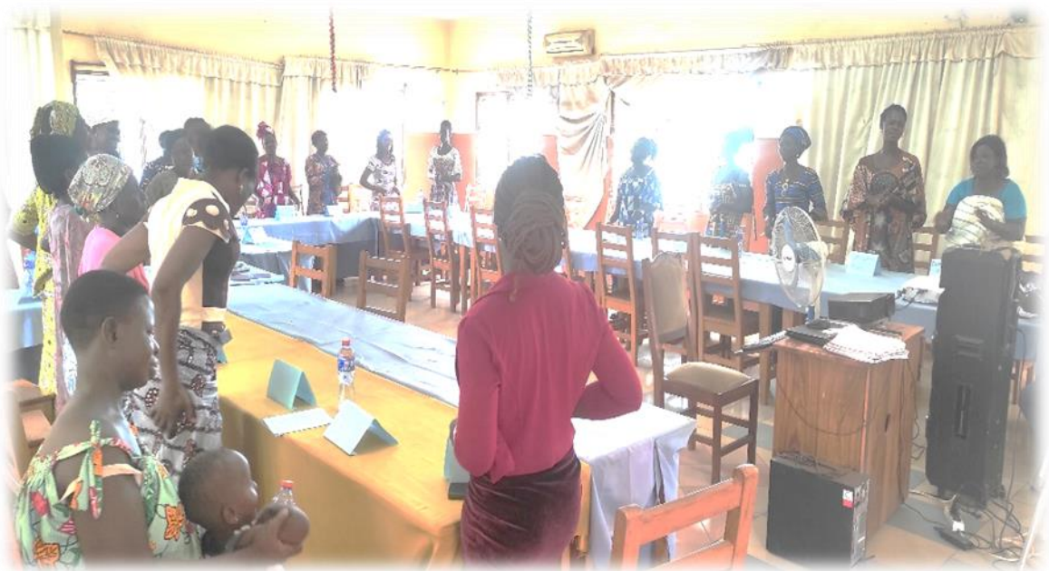
Figure 9 : photo d'une séance de formation théorique